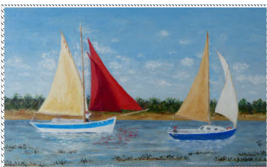
Remontée de la Seudre C.R.