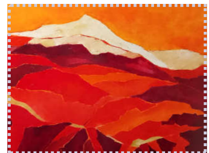
Mont Ventoux