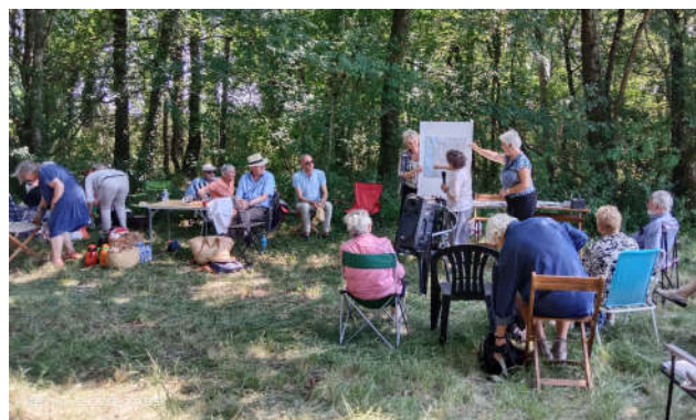
Une assistance attentive