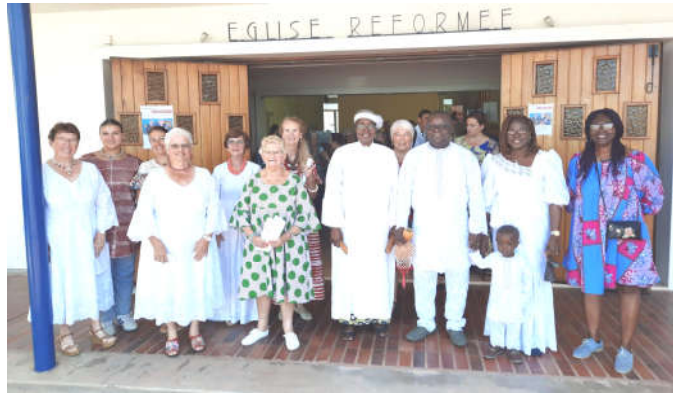
Chorale et pasteur