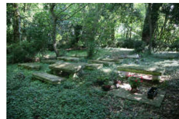
Cimetière à Coulonges