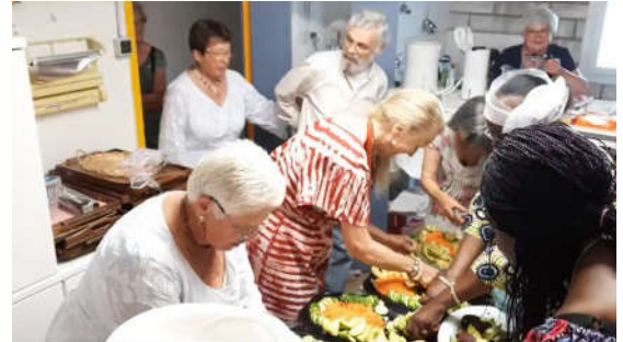
Il y a du monde en cuisine