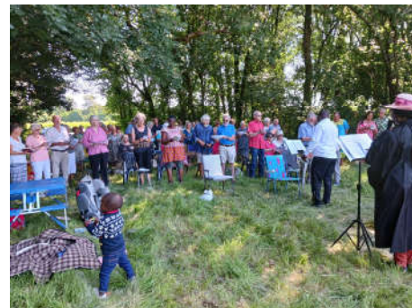
Dimanche 25 juin 2023 dans les bois de Coulonges